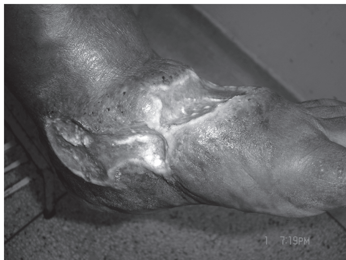
Figura 1 Mostra lesão ulcerada em paciente com lipolinfedema.

O presente caso mostra uma evolução do lipedema para lipolinfedema e uma intercorrência não relatada nos indexadores LILACS e Pubmed. A paciente relata vários episódios de erisipela e este fato pode ser o responsável pela evolução para o lipolinfedema e da lesão ulcerada. A ferida surgiu após evento de erisipela, portanto uma associação com o evento úlcera. A literatura sugere alterações linfáticas nos pacientes com lipedema, 4,5